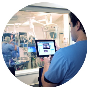
TEAMSIM Operationssimulering för kirurgteamet