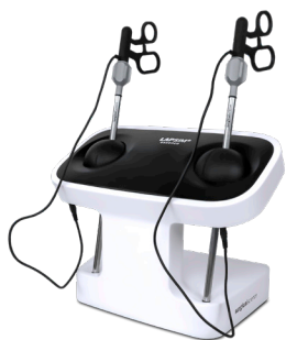
LAPSIM ESSENCE Nedskalad laparoskopisimulator