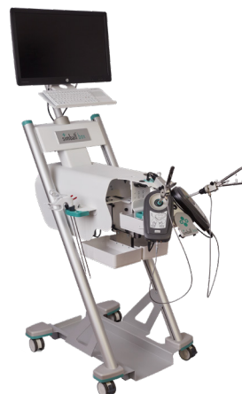
SIMBALL BOX Objektiv mätning vid träning med egna instrument