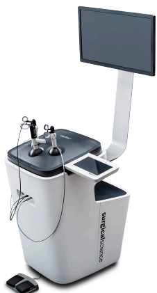
LAPSIM Simulering av laparoskopisk kirurgi