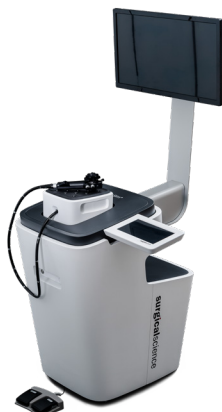
ENDOSIM Simulering av endoskopiska undersökningar