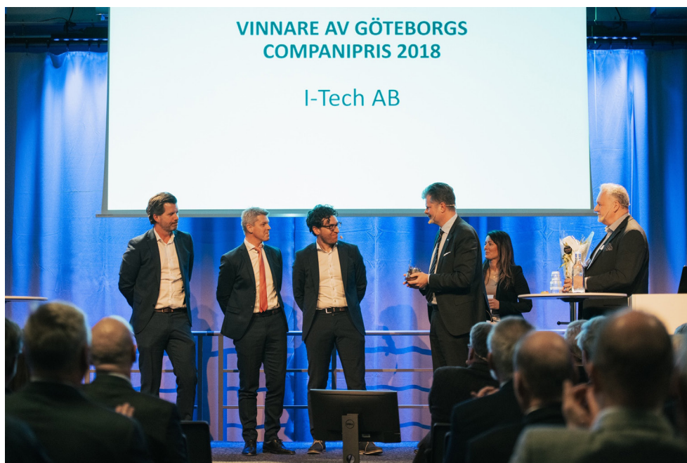
I april 2019 vinner I-Tech AB Göteborgs Companipris 2018

Bolaget noterades under 2018 på Nasdaq First North och genomförde en nyemission i samband med noteringen. Totalt tillfördes bolaget 40 miljoner kronor, rensat från emissionskostnader, och bolaget har nu medel att genomföra strategiska satsningar för att nå uppsatta långsiktiga mål. Satsningarna inbegriper process och metodutveckling inom produktion i syfte att öka effektiviteten, utveckling av leverantörsbasen, expansion av den kommersiella styrkan i bolaget samt ökad R&D verksamhet för att stödja befintlig affär samt utveckla nya potentiella applikationsområden. Till sist ingår en satsning på nya marknader där regulatoriska processer förväntas initieras framöver.