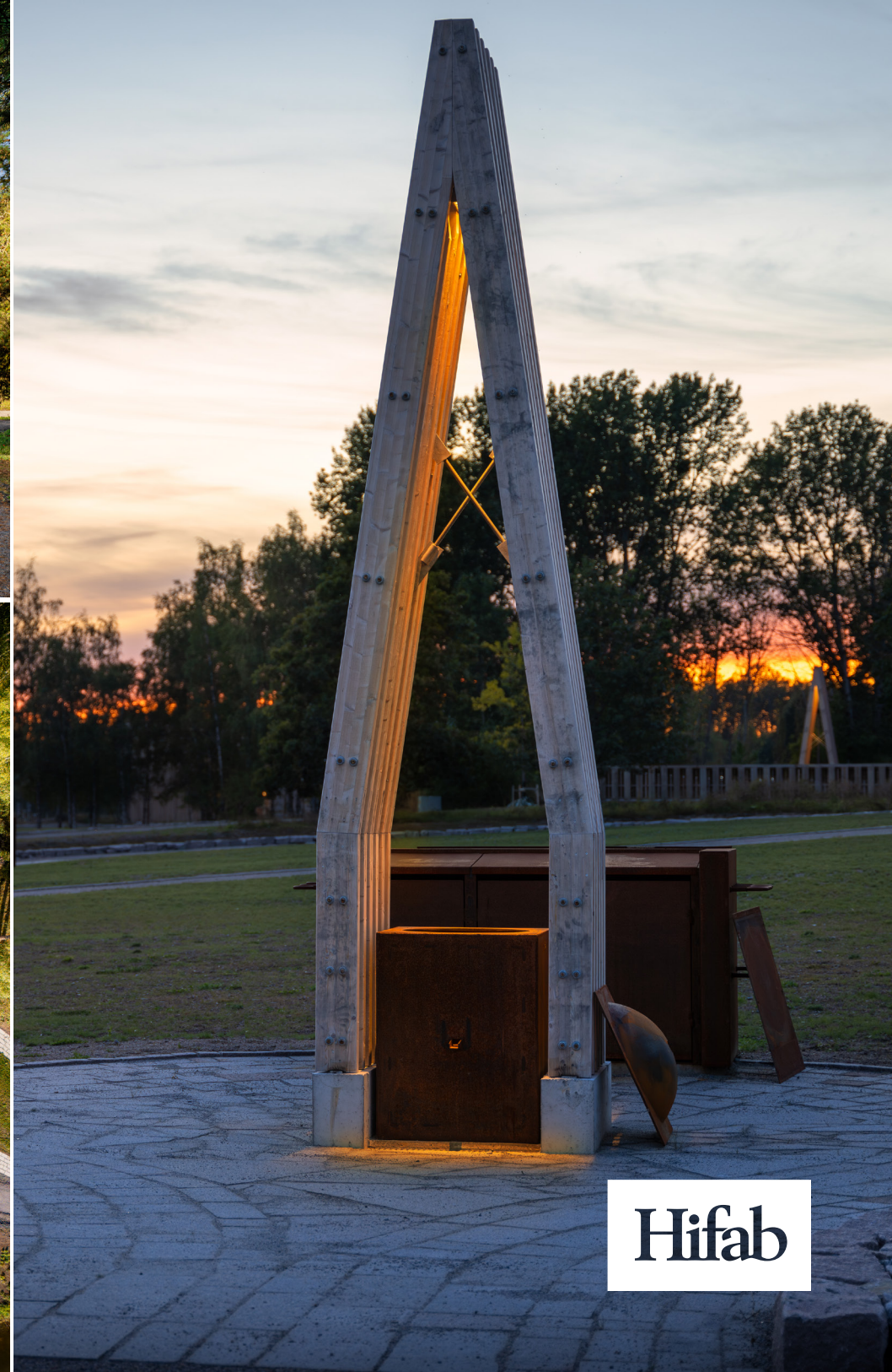
Järva begravningsplats i nordvästra Stockholm. Hifab har mellan 2016 och 2024 varit ansvarig Projektledare för byggandet av den nya begravningsplatsen, som invigdes i slutet av september 2024.