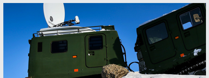
Kebni Satmission Drive-away antenn installerad på militär bandvagn