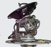
Kebnis Maritima antenn

Kebnis maritima antenner har ett 4-axligt stabiliseringssystem, vilket möjliggör stabil satellitkommunikation oavsett hur fartyget rör sig. Systemet är unikt på marknaden vad gäller robusthet och prestanda under svåra förhållanden, vilket bevisats i de militära miljötester det utsatts för. Efter åtta år av utveckling och leveranser till kunden IAI är produkten nu redo för försäljning till det krävande försvars- och myndighetssegmentet.