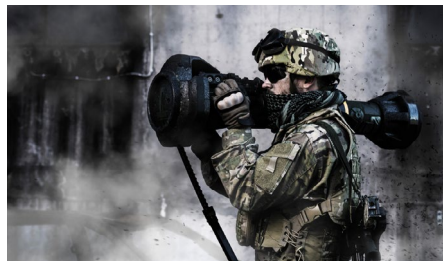
Saab NLAW.

Kebni Tailored solutions är helt skräddarsydda och kundanpassade Inertial Sensing-lösningar, exempelvis den IMU ( Inertial Measurement Unit ) som Kebni utvecklar till Saabs antitanksystem NLAW.