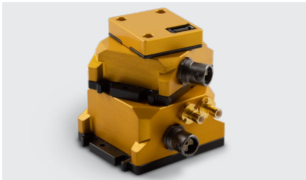
Kebni SensAltion, lansering 2023

Kebni utvecklar och erbjuder standardiserade och anpassningsbara multi-sensorplattformar för integration i autonoma system och fordon. Den första produktfamiljen Kebni SensAltion lanseras under 2023.