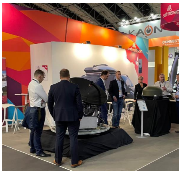
Kebni och Satmission ställer ut på IBC