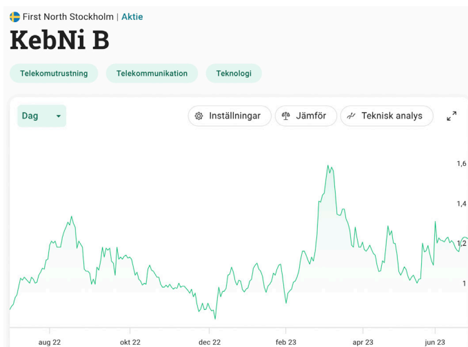
Grafen visar Kebni-aktiens utveckling, perioden 220630 – 230630, grafen är hämtad från Avanza.

G&W Fondkommission är bolagets Certified Adviser.