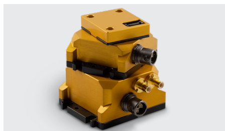
Kebni SensAltion, lansering 2023

Kebni utvecklar och erbjuder standardiserade och anpassningsbara multi-sensorplattformar för integration i autonoma system och fordon. Den första produktfamiljen Kebni SensAltion lanseras under hösten 2023.