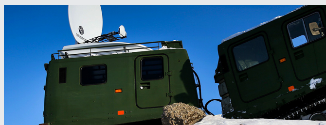
Kebni Satmission Drive-away antenn installerad på militär bandvagn