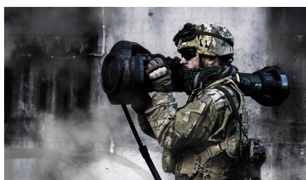
Saab NLAW.

Kebni Tailored solutions är helt skräddarsydda och kundanpassade Inertial Sensing-lösningar, exempelvis den IMU ( Inertial Measurement Unit ) som Kebni utvecklar till Saabs antitanksystem NLAW.