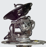
Kebni's Maritima antenn

Kebnis maritima antenner har ett 4-axligt stabiliseringssystem, vilket möjliggör stabil satellitkommunikation oavsett hur fartyget rör sig. Systemet är unikt på marknaden vad gäller robusthet och prestanda under svåra förhållanden, vilket bevisats i de militära miljötester det utsatts för. Efter åtta år av utveckling och leveranser till kunden IAI är produkten nu redo för försäljning till det krävande försvars- och myndighetssegmentet.