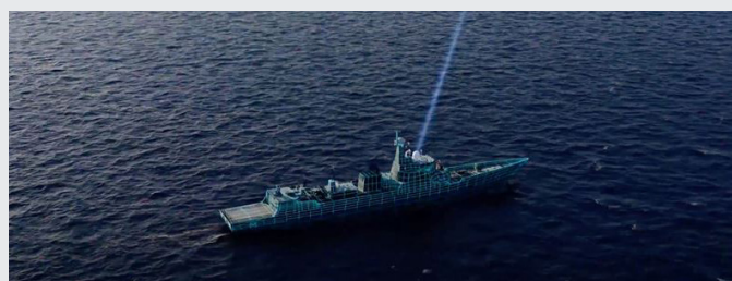
Fartyg med maritim satellitantenn