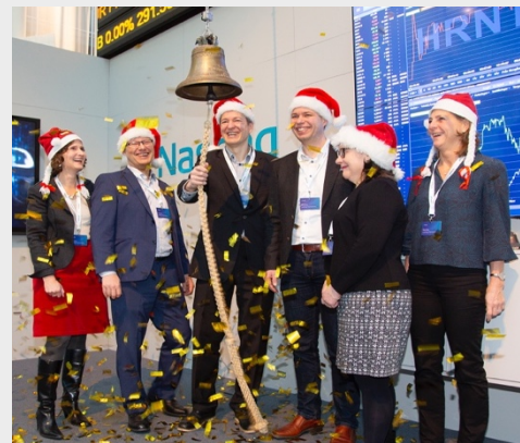
Tonttuja liikkeellä! Herantiksien johtoryhmän ja hallituksen jäseniä soittamassa Nasdaqin kelloa Tukholmassa