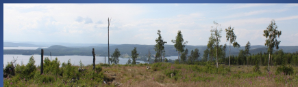
Kräkatorpet, Sundsvalls kommun; 52 vindkraftverk