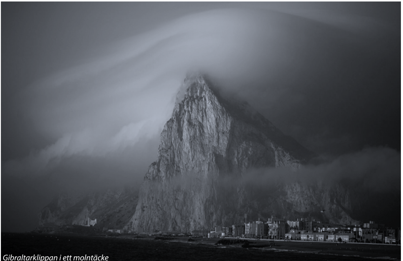
Gibraltarklippan i ett molntäcke