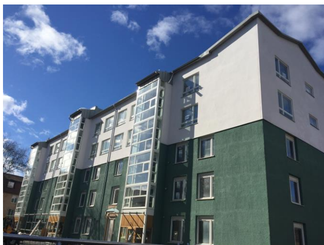
Kvarteret Hedvig, ett ombyggnadsprojekt åt Svenska Bostäder i Stockholm.