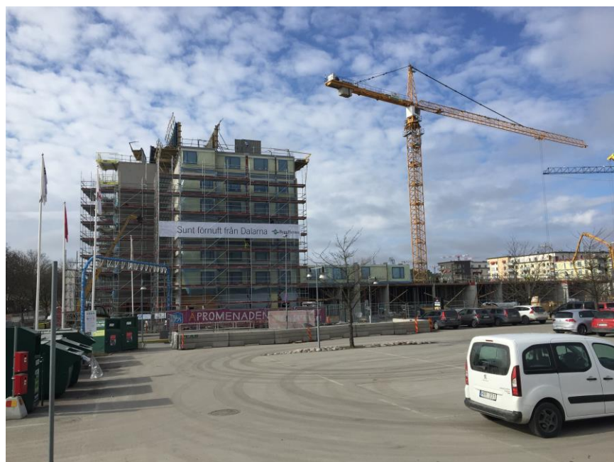
Å-promenaden, pågående projekt i Uppsala åt Uppsalahem.