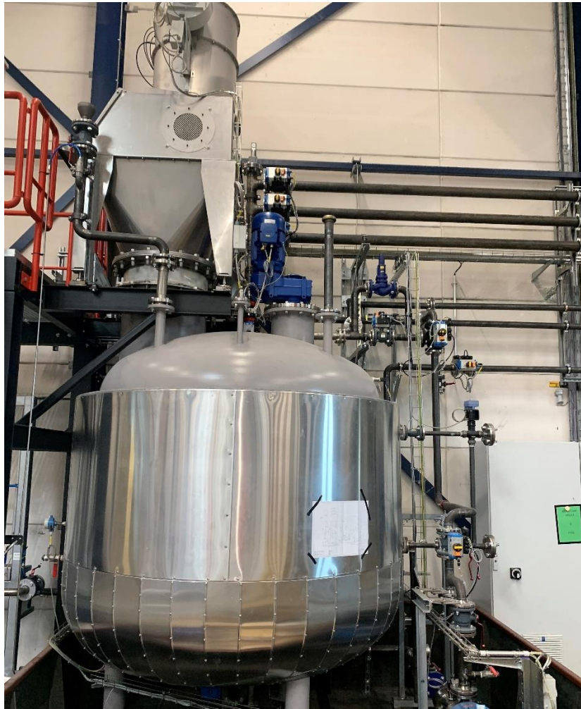
Utrustning som kund har investerat i för att tillsätta Quartzene® i sin produkt.

Gällande bolagets övriga kundläge berättar Tor Einar Norbakk: