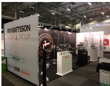
FM Mattsson Mora Group blev utsedd till årets fabrikant av Comfort-kedjan.