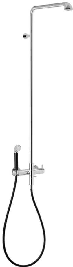
Damixa Tradition Pullout och A-Pex takdusch belönades i april med det internationella designpriset Red Dot Design award för bästa produktdesign 2016.