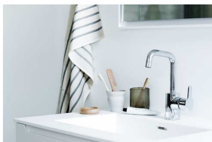
En förstärkning i Pine-familjen – en tvättställsblandare med hög pip.