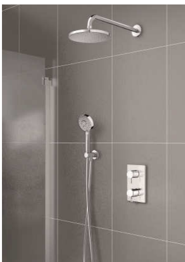
Under kvartalet lanserades Damixas inbyggnadslösning.

” Jag och mina kollegor är stolta över vår historik men fokuserar fullt ut på framtiden och hur vi kan utveckla verksamheten. ”